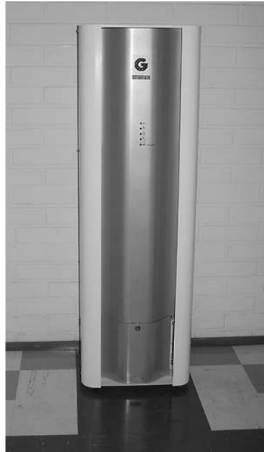
Kuva 2. Kotimainen Genanon kehittämä ja valmistama pienhiukkasten suodattamiseenkin pystyvä laite. Sopii asuintiloihin ja vaativiinkin törmistöihin.

Tärkeä kehityshaaste liittyy myös pienhiukkasten mittaustekniikkaan. Myös se oli esillä FINE-ohjelmassa. Pienhiukkaset eivät ole yhtä helposti aistittavissa kuin lämpötila. Huoneilman pienhiukkasongelmiin mittaaminen ja havainnointi on saatava kehitettyä tarkemmaksi ja helpommaksi. Voisi myös ajatella kehitettävän automaattisesti huoneilman pienhiukkaspitoisuuden mukaan ohjautuvia huoneilman puhdistimia.