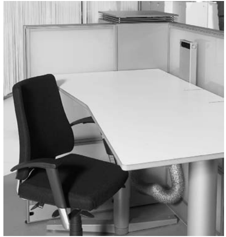
Kuva 3. Martelan ja LIFA-AIRin kehittämä koti- mainen ZEPHYR toimistotyöpöytä, jossa on mukana huoneilmaa kierrättävä ja tehokkaasti pienhiukkasia suodattava 3 g suodatin.

FINE-ohjelman mukaan huoneilman pienhiuk- kasten torjuntaan, mm. tulo- ja kierrätysilman suodatukseen liittyvä teknologia on Suomessa kansainvälisesti katsoen kehittyntä ja kilpai- lukykivistä. Erittäin tärkeää kuitenkin on, että pienhiukkasten merkitys terveydelle tunnuste- taan paremmin ja laajemmin oleelliseksi osaksi hyvää ja terveellistä työ- ja asuinympäristöä. Merkkejä ajatustavasta on jo ollut havaittavissa,