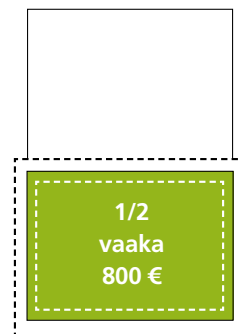
Kokonaispinta-ala 180 x 125 + leikkuuvara 5 mm